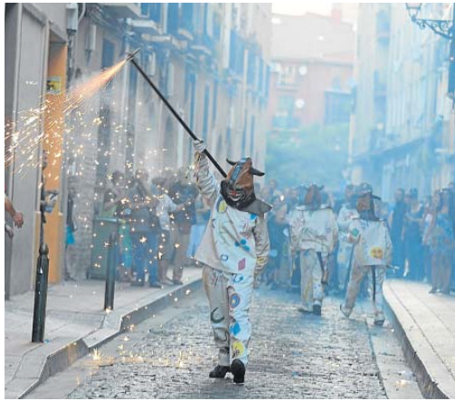
Uno de 'los diables de La Magdalena', ayer. FRANCISCO JIMÉNEZ