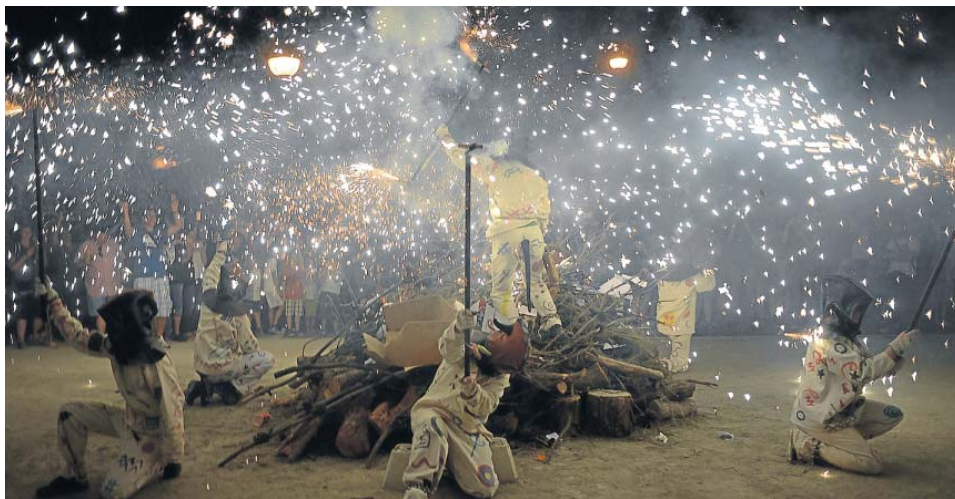
Los Diaples de la Madalena instantes antes de prender la hoguera de San Juan en el parque Bruil de Zaragoza. FRANCISCO JIMÉNEZ

El Tribunal Superior de Justicia estima el recurso de los obispos aragoneses a la orden de la DGA y mantiene Religión en horario lectivo de forma cautelar. PÁG. 11