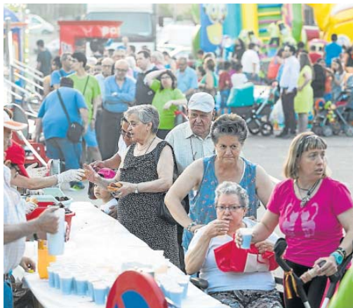
En Casablanca se repartieron bocatas y bebidas.. ARÁNZAZU NAVARRO

Pero ya antes de prender la primera fogata las celebraciones se extendieron por Zaragoza. En la Magdalena, 'los diables' hicieron de las suyas armados con petardos y otros fuegos de artificio. Al ritmo que marcaba la batukada,