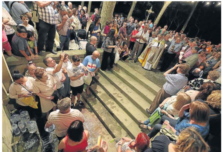
Cientos de oscenses acudieron anoche al rito purificador en la fuente de Cillas.

las calles de la capital aragonesa. El ingenioso hidalgo fue el encargado de prender poco antes de medianoche la hoguera de Las Delicias. Un pequeño homenaje por el 400 aniversario de la muerte de Cervantes que atrajo la atención de todos los vecinos.