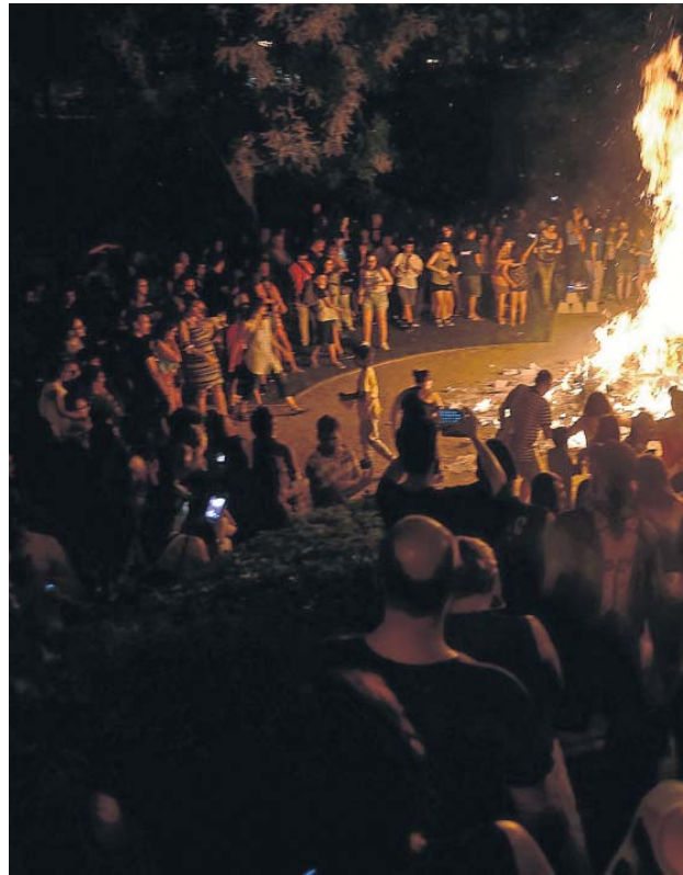
Animación alrededor de la hoguera del parque Bruil. FRANCISCO JIMÉNEZ

con saltos, brincos y piruetas, persiguieron a los niños –y también a algún adulto– por el barrio con sus bastones lanzando chispas. Las estrechas callejuelas hicieron que cada estallido retumbara, y el olor de la pólvora pronto cubrió el aire. Con esta alegre cacofonía estos nueve particulares diablillos se pasearon por la plaza de San Agustín y la iglesia de La Magdalena, para luego volver hasta el parque Bruil. Allí un año más se prendió la fogata más